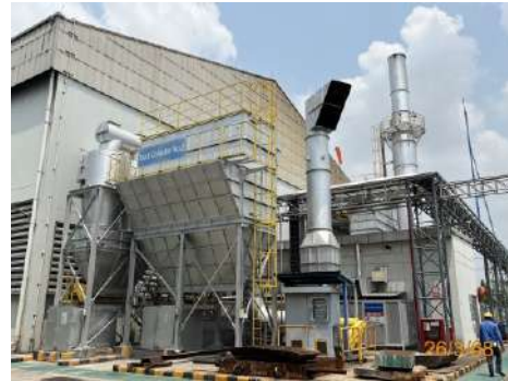
DC No.2 : MRM