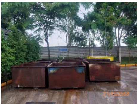
ถังเหล็กเก็บเศษเหล็ก