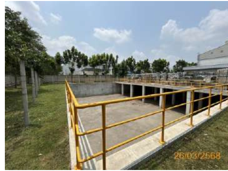
ภาพที่ 2-28 บ่อหน่วงน้ำฝนของโครงการ