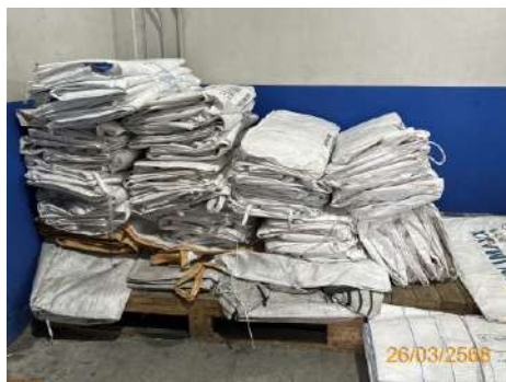
ภาพที่ 2-21 ถุงกระสอบ Big Bag สำหรับใส่ของเสียปนเปื้อน