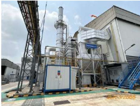
DC No.1 : Furnace