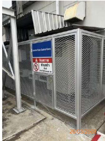
ภาพที่ 2-32 ตู้ควบคุมระบบไฟฟ้าแผงเซลล์แสงอาทิตย์ (Inveter Solar Control Room)