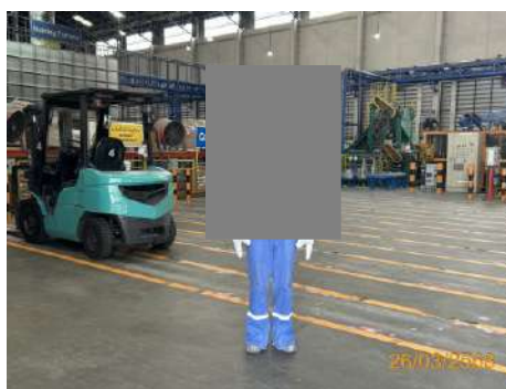
ภาพที่ 2-7 พนักงานสวมใส่อุปกรณ์ป้องกันอันตรายส่วนบุคคล