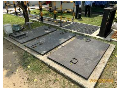
ภาพที่ 2-11 บ่อตรวจสอบ (Inspection Pit) และบ่อพักน้ำทิ้ง (Holding Pond)