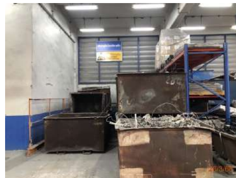
ถังเหล็กเก็บเศษเหล็กติดอะลูมิเนียม