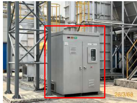
ระบบดักกลิ่น