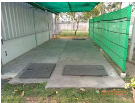
ภาพที่ 2-12 บ่อพักน้ำฉุกเฉิน (Emergency Pond)