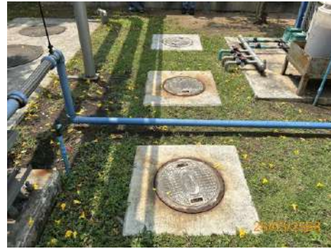
ภาพที่ 2-9 ถังดักไขมันบริเวณโรงอาหาร