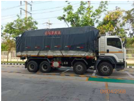
ภาพที่ 2-16 ผ้าใบปิดคลุมรถบรรทุกที่มีดซิด