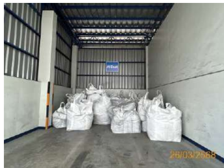
ถุง Big Bag เก็บฝุ่นจากระบบบำบัด