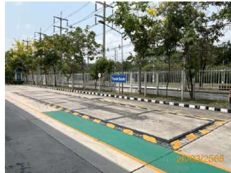
ภาพที่ 2-15 เครื่องขังน้ำหนักรถบรรทุก