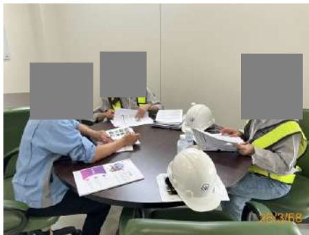
ภาพที่ 2-1 การติดตามตรวจสอบการปฏิบัติตามมาตรการฯ

จากการตรวจสอบการปฏิบัติตามมาตรการป้องกันและแก้ไขผลกระทบสิ่งแวดล้อม โครงการโรงงานหลอมและหล่ออะลูมิเนียมแท่ง (ครั้งที่ 1) บริษัท นิคเคอิ เอ็มซี อลูมิเนียม (ประเทศไทย) จำกัด (ระยะดำเนินการ) เมื่อวันที่ 26 มีนาคม 2568 สามารถสรุปผลการปฏิบัติตามมาตรการป้องกันและแก้ไขผลกระทบสิ่งแวดล้อม ดังรายละเอียดในตารางที่ 2.2-1 และเอกสารอ้างอิงประกอบการปฏิบัติตามมาตรการฯ ในภาคผนวกที่ 1