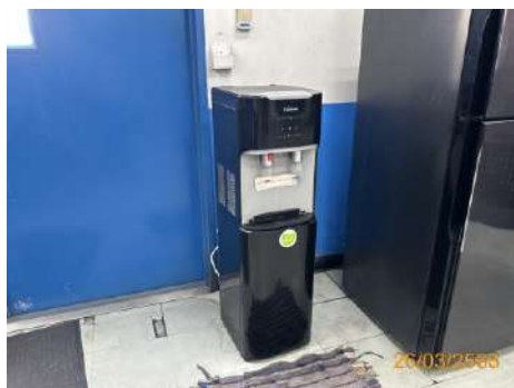
ภาพที่ 2-23 ถังน้ำดื่ม