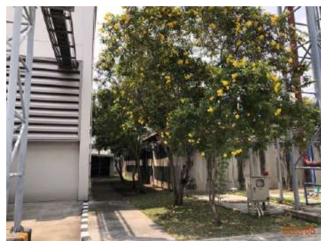
ภาพที่ 2-6 ไม้ยืนต้นบริเวณของเขตพื้นที่โครงการ