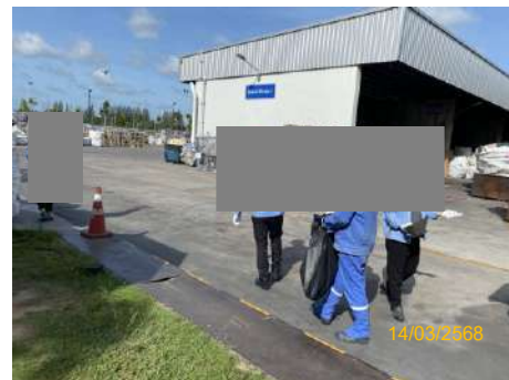
ภาพที่ 2-30 พนักงานทำความสะอาดบริเวณภายในพื้นที่โครงการ