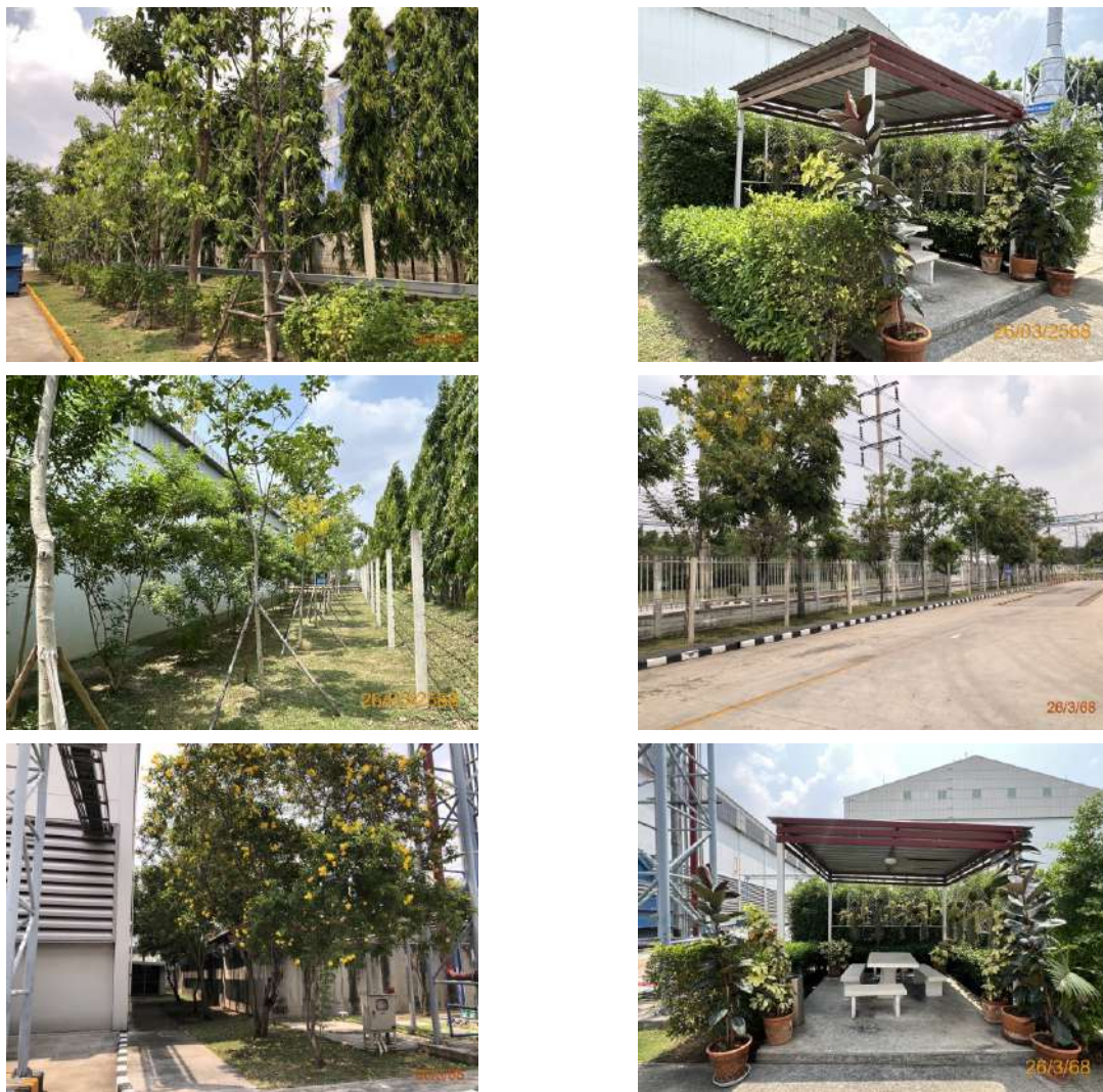
ภาพที่ 2-6 ไม้ยืนต้นบริเวณของเขตพื้นที่โครงการ (ต่อ)