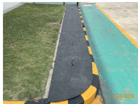
ภาพที่ 2-13 รางระบายน้ำฝน