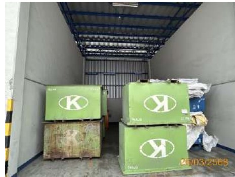
ถังเหล็กสำหรับใส่ตะกรันอะลูมิเนียม