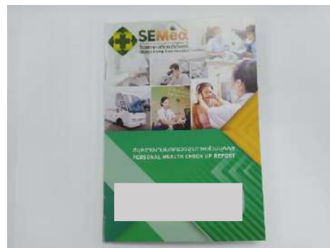
ภาพที่ 2-22 ตัวอย่างสมุดสุขภาพพนักงาน