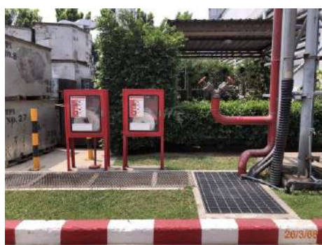
ภาพที่ 2-27 ระบบป้องกันและระงับอัคคีภัยในพื้นที่โครงการ