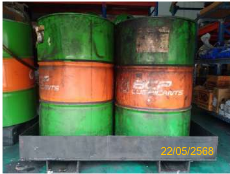
ถังเหล็ก 200 ลิตร จัดเก็บน้ำมันเครื่องใช้แล้ว