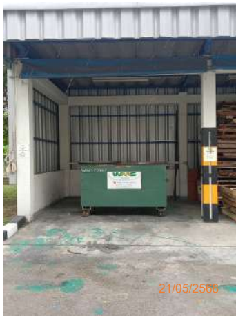
ภาพที่ 2-18 พื้นที่รวบรวมขยะมูลฝอย