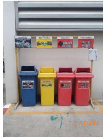
ภาพที่ 2-17 จุดวางถังขยะแยกตามประเภท