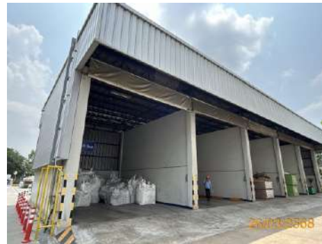
ภาพที่ 2-19 พื้นที่จัดเก็บของเสียจากกระบวนการผลิต