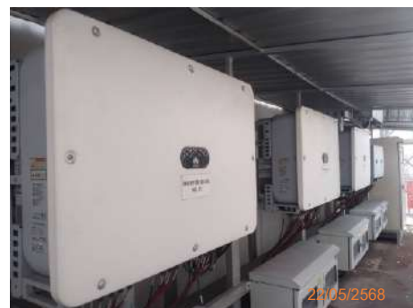
ภาพที่ 2-31 การติดตั้งสายดิน