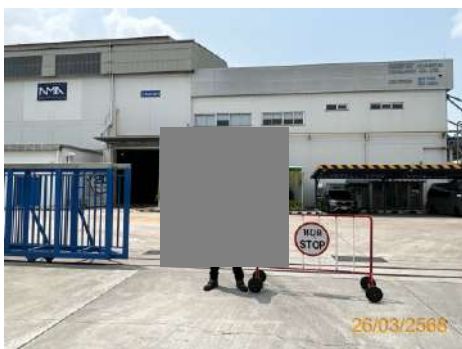
ภาพที่ 2-14 เจ้าหน้าที่อำนวยความสะดวก บริเวณเข้า-ออก โครงการ