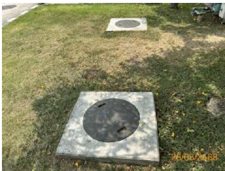
ภาพที่ 2-10 ระบบบำบัดน้ำเสียสำเร็จรูป (Septic Tank)