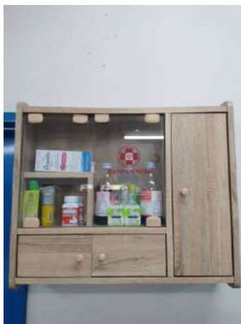
ภาพที่ 2-26 เวชภัณฑ์ยา