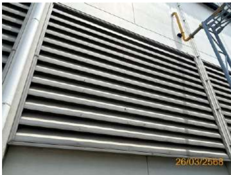
ภาพที่ 2-3 ระบบระบายอากาศในอาคาร บริเวณที่มีความร้อนสูง