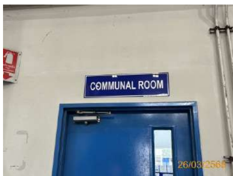
ภาพที่ 2-25 ห้องพักสำหรับพนักงาน