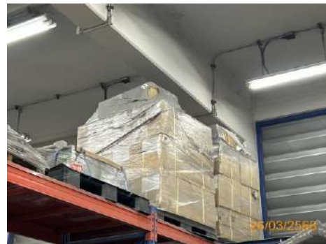
ภาพที่ 2-4 อะไหล่สำรองและอุปกรณ์